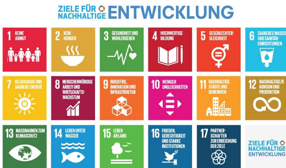
Abbildung 2: Die 17 Ziele für nachhaltige Entwicklung

Auf der Vollversammlung der Vereinten Nationen im September 2015 in New York wurden mit der Agenda 2030 17 globale Nachhaltigkeitsziele (SDGs) für eine nachhaltige Entwicklung beschlossen. Zusammen mit ihren 169 Unterzielen verzahnen die SDGs die ökonomische, ökologische und soziale Dimension von Nachhaltigkeit. Im Hinblick auf die Umsetzung der Agenda 2030 und der Deutschen Nachhaltigkeitsstrategie kommt der kommunalen Ebene eine besondere Rolle zu, denn nahezu alle der 17 SDGs stehen im direkten oder indirekten Zusammenhang mit den Aufgaben einer Kommune.