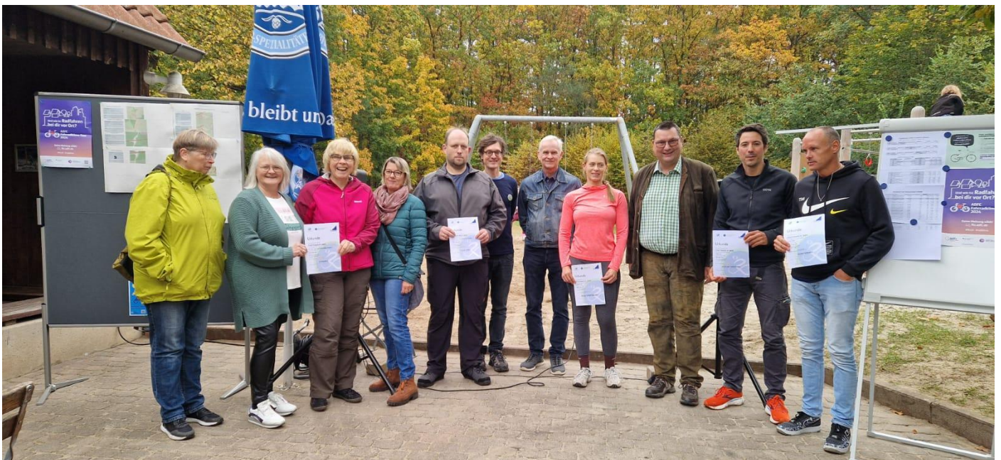
Abbildung 7 Stadtradeln