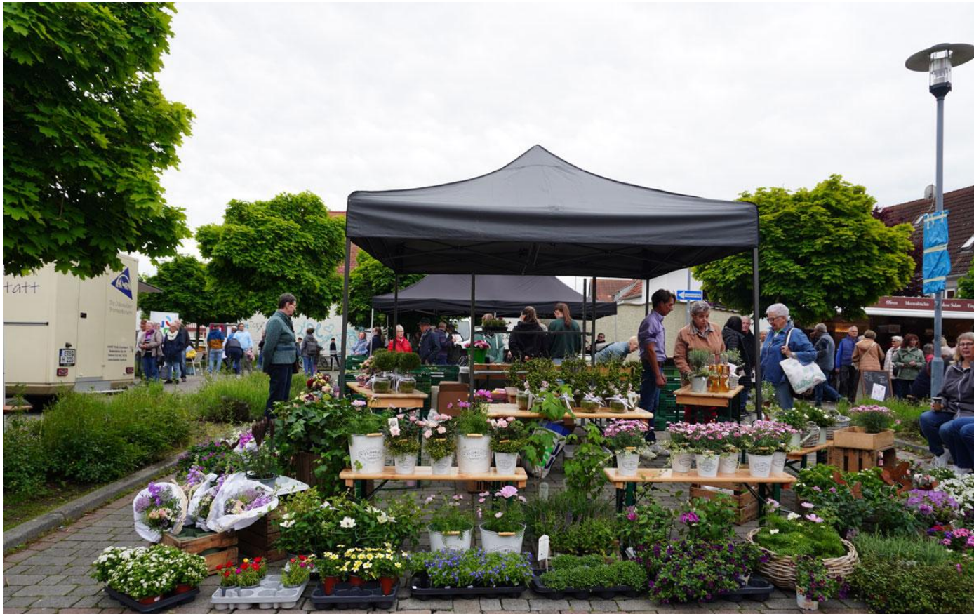
Abbildung 5 Pfungstädter Naschmarkt