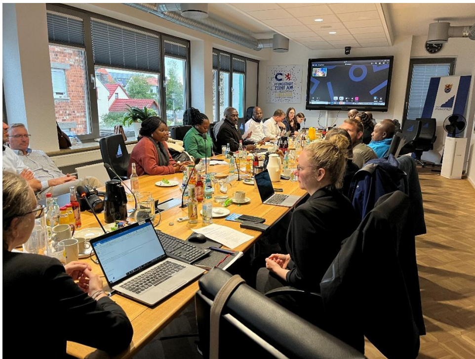
Abbildung 4 Austausch mit der Partnerkommune