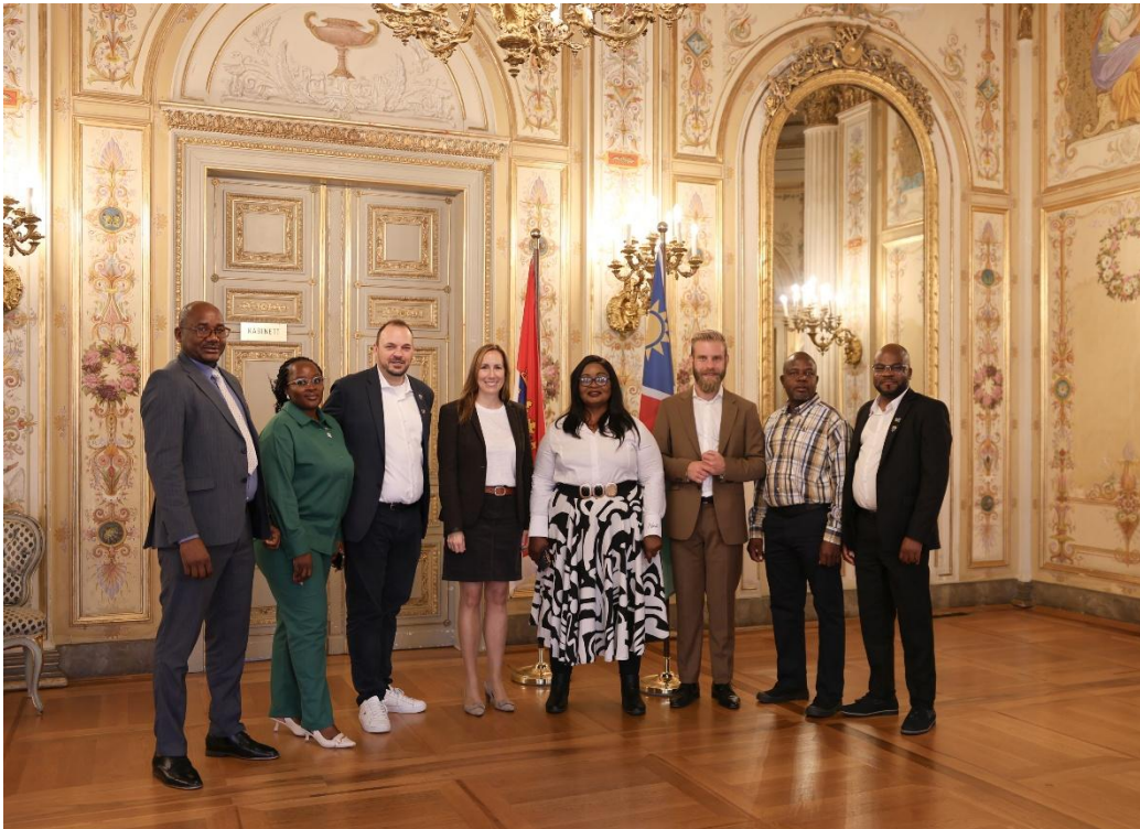
Abbildung 6 Delegation aus Namibia, (c) Hessischer Landtag

Pfungstadt übernimmt Verantwortung für globale Nachhaltigkeit, fördert faire Beschaffung und pflegt partnerschaftliche Beziehungen mit Kommunen weltweit.