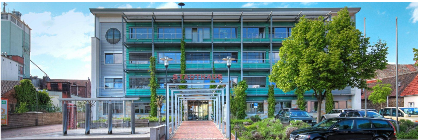
Abbildung 3 Stadthaus