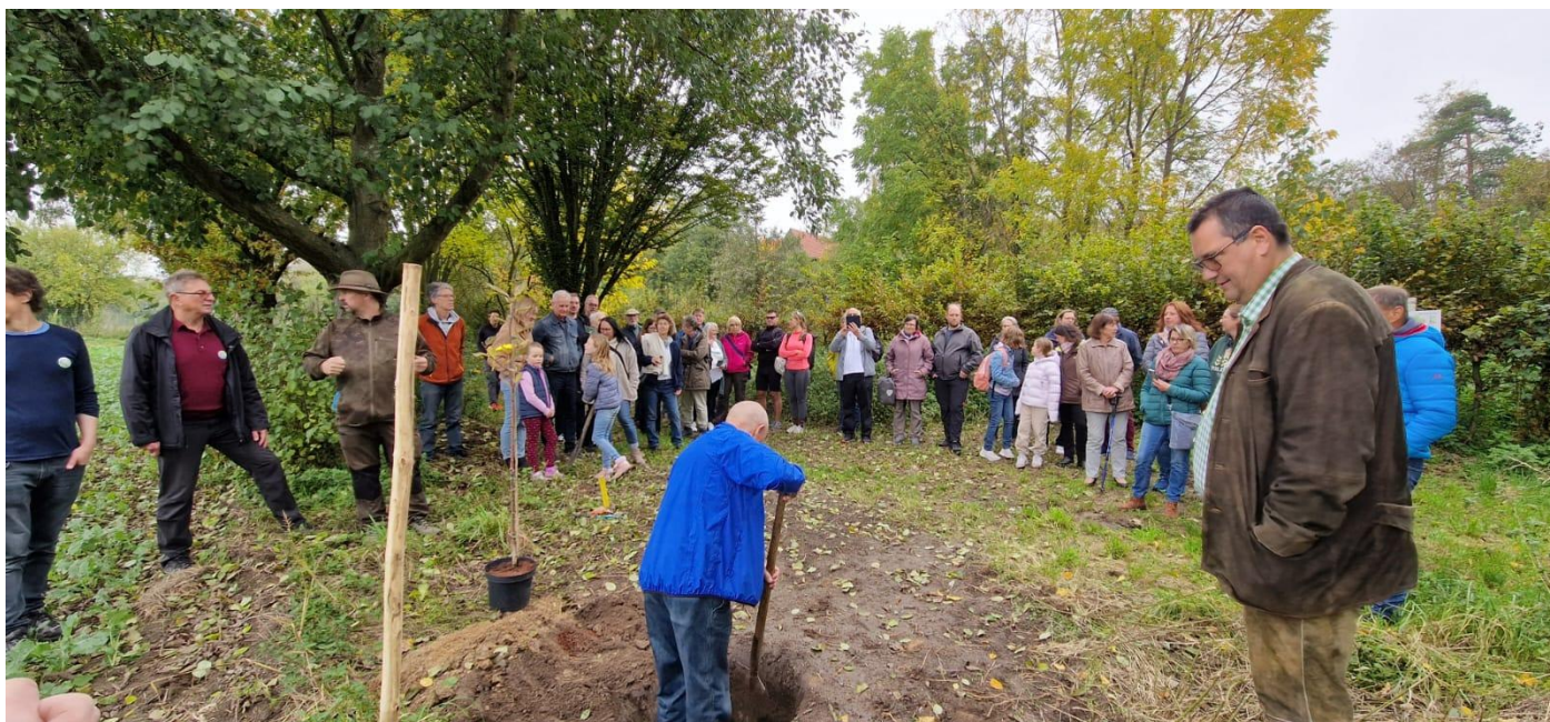
Abbildung 1 Baumpflanzaktion zum Stadtradeln