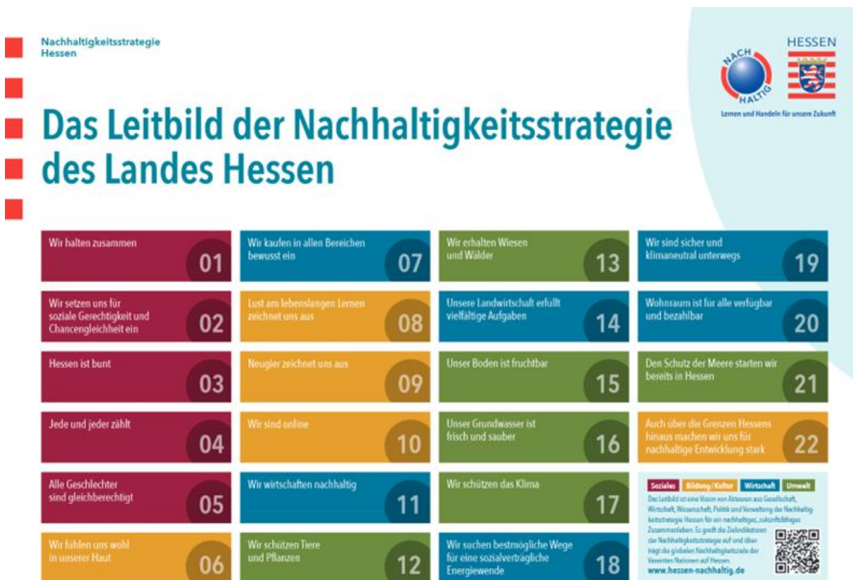
Abbildung 2: Das Leitbild der (früheren) Nachhaltigkeitsstrategie Hessen.